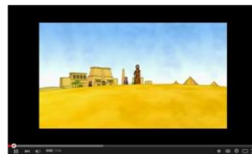
15 Moses Parts the Red Sea